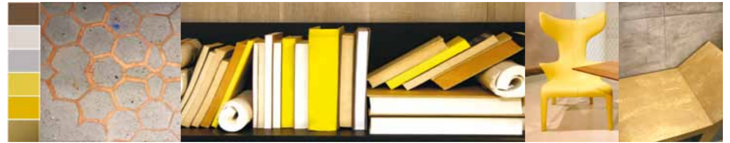
Gesehen bei Messe Farbe, B&B Italia, Driade, Novacolor (v. l. n. r.).