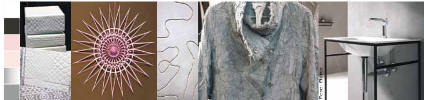
Gesehen bei Vivant, Trendforum Heimtextil, Messe Farbe, in Mailand (v. l. n. r.).

Der Trend-Ausblick für die nächsten Jahre ist farbig und voller haptischer Erlebnisse. Rosa erobert den Purismus, während Gold aus dem klassisch eleganten Wohnen nicht mehr wegzudenken ist. Grün zeigt sich in immer mehr Facetten von warmen Naturtönen bis hin zum kühlen Flaschengrün und Rot nutzt die ganze Bandbreite von Orange bis hin zum kühlen, pinkigen Rot. Um sich im Dschungel dieser Vielfalt entspannt wohlzufühlen, kommt es auf die richtige Kombination an. Unsere Kolumnistin Uta Kurz zeigt Ihnen die wichtigsten Trendthemen mit Hintergründen und Tipps für die Umsetzung in Architektur und Bad.