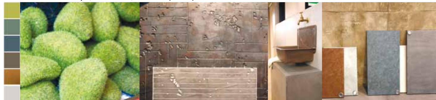
Gesehen bei Stucco Pompei, Messe Farbe, Novacolor (v. l. n. r.).

Das Thema Natur begleitet uns schon sehr lange, und es ist auch in Zukunft nicht aus dem Portfolio der Produkte wegzudenken, denn nichts ist so alt wie die Koexistenz von Mensch und Natur, die tief im Gehirn verankert ist. Wir sehnen uns nach Naturerlebnissen, wollen aber auch die Vorteile städtischen Wohnens genießen. Es erstaunt also wenig, dass im Design der Moderne die reduzierte Formensprache der Urbanität mit dem unberührten, archaischen Ausdruck der Natur kombiniert wird. Voll im Trend liegen Naturmaterialien und Reproduktionen, die dank digitaler Drucktechnik oft kaum noch vom Original zu unterscheiden sind. Wald- und Bergmotive als Fototapete werden durch Beton und Glas ergänzt, um den unverwechselbaren Mix aus Natur und Technik abzubilden.