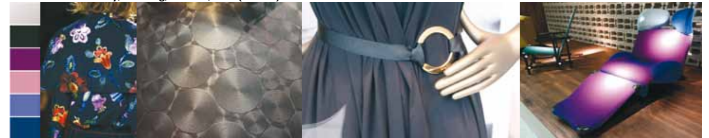
Gesehen bei Burberry, Marburg, Mailand, IMM (v. l. n. r.).

Wohlfühlen in den eigenen vier Wänden ist den Menschen heute ganz besonders wichtig. Doch der Weg zum individuellen Wohlgefühl ist sehr unterschiedlich. Während der eine die kühle und sachliche Atmosphäre des Purismus schätzt, sucht der andere die erdigen Farben der Natur, um sich von der Hektik des Alltags zu erholen. Doch egal, ob Gold oder Chrom, die richtige Farb- und Materialkombination macht glücklich und davon profitieren am Ende alle. Denn die richtige Farbe beeinflusst zu immerhin rund 60 Prozent die Kaufentscheidung der Kunden.