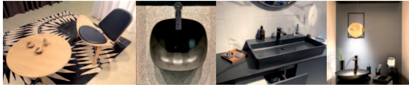
Gesehen bei Carl Hansen, Roca, Villeroy & Boch und Hansgrohe (von links).

Text und Fotos: Uta Kurz, Coaching Innovation