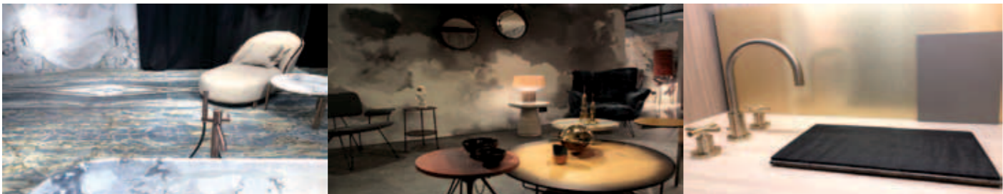
Gesehen bei Antolini, Diesel, Dornbracht

Weiche Formen und fließende Farbverläufe zwischen Blau, Mint und Grün repräsentieren die Vielfalt des Wassers, das wie die Farbe Türkis neue Kraft mobilisiert und für einen klaren Kopf sorgt. In dieser Atmosphäre werden schöne Erinnerungen an den letzten Urlaub am Meer geweckt. Mit der Wiederentdeckung alter Kneipp-Rituale und moderner Massageduschen können wir das glitzernde Prickeln des Ozeans auch im eigenen Zuhause spüren. Kombiniert mit hellem Holz und grauer Steinoptik entstehen Räume, die Erfrischung, Vitalität und gute Laune ausstrahlen.