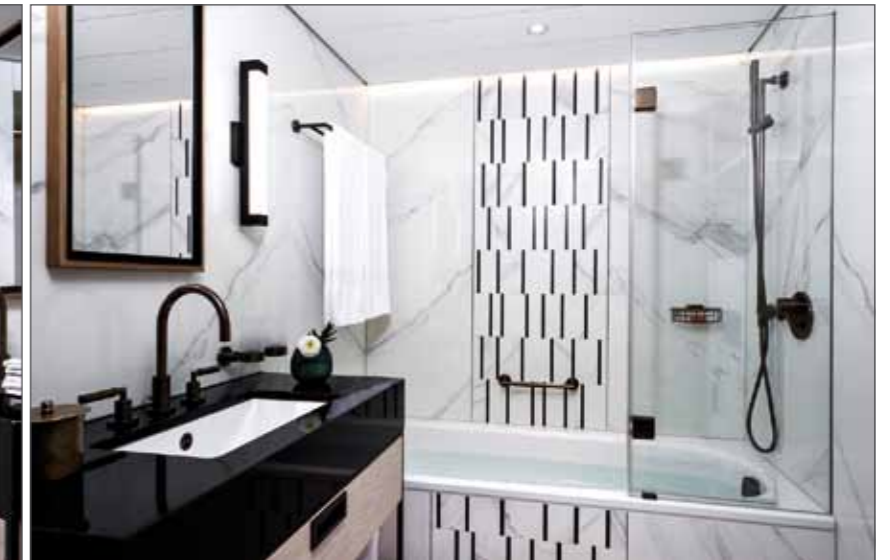
Die Verwendung von Marmor mit schwarz-weißen Akzenten ist eine Anspielung auf das Federkleid des Storches, die Details aus Holz stehen für die Nestwärme („Storchennest“). Besondere Aufmerksamkeit galt auch der Verlegung des Marmors mit der gespiegelten Maserung (links).