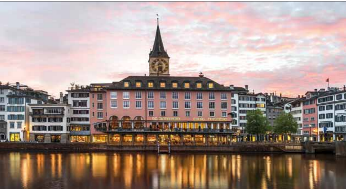
Allein die exponierte Lage am Limmat-Ufer macht das Denkmal geschützte Hotelgebäude zu Hingucker.