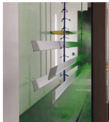
Die Schlüter-Produkte, wie hier das Sockelprofil Designbase-SL, erhalten in der modernen Beschichtungsanlage eine hochwertige Pulverbeschichtung.