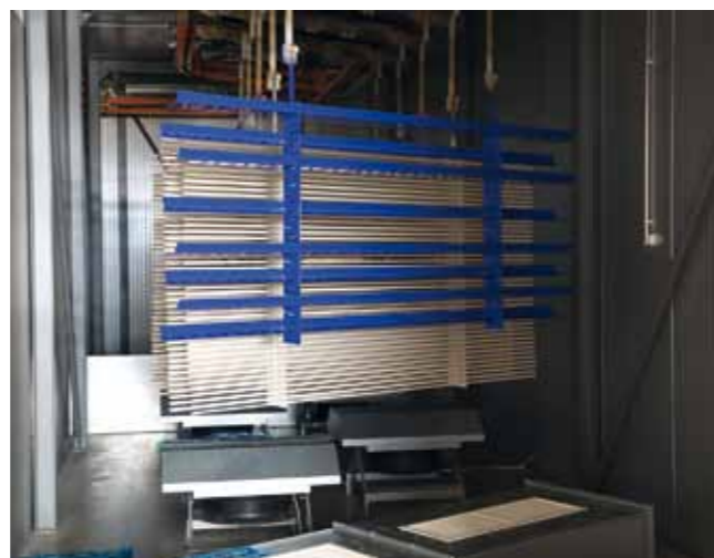
Text und Fotos: Schlüter-Systems

➔ „MyDesign by Schlüter-Systems erlaubt jetzt die individuelle und hochwertige Beschichtung unserer Produkte in 190 Farben der RAL-CLASSIC-Farbpalette“, so Marc Schlüter. Ganz gleich, ob Räume oder ganze Gebäude gemäß den Vorgaben eines Corporate Designs gestaltet werden oder Anschlüsse und Kantenschutz passend zu farbiger Objektkeramik ausgeführt sollen, ein privates Bad in der persönlichen Lieblingsfarbe entstehen oder der Balkonrand farblich akzentuiert werden soll: „MyDesign erlaubt in dieser Hinsicht nahezu jeglichen Gestaltungswunsch.“