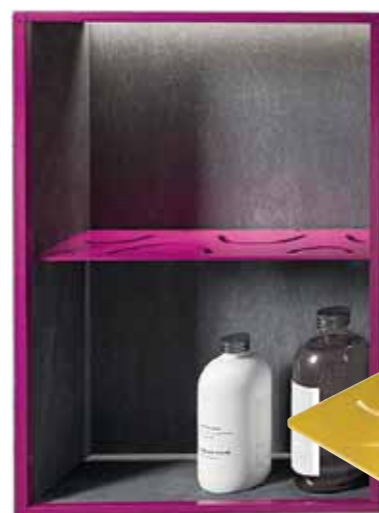
Hier beweist die Ablage Schlüter-Self, die es mit verschiedenen Loch-Dekoren gibt, ihre Vielseitigkeit: Für die Anwendung in den vorgefertigten Schlüter-KERDI-BOARD-Nischen steht das SHELF-S zur Verfügung, das passgenau in die Nische integriert werden kann. Unten eine Shelf-Variante in Zitronengelb, die in den Fliesenbelag integriert werden kann

Mit farbig beschichteten Profilen lassen sich die Kanten und Sockel von Fliesen- und Natursteinbelägen individuell